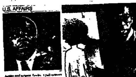
Who Shot Vernon Jordan?